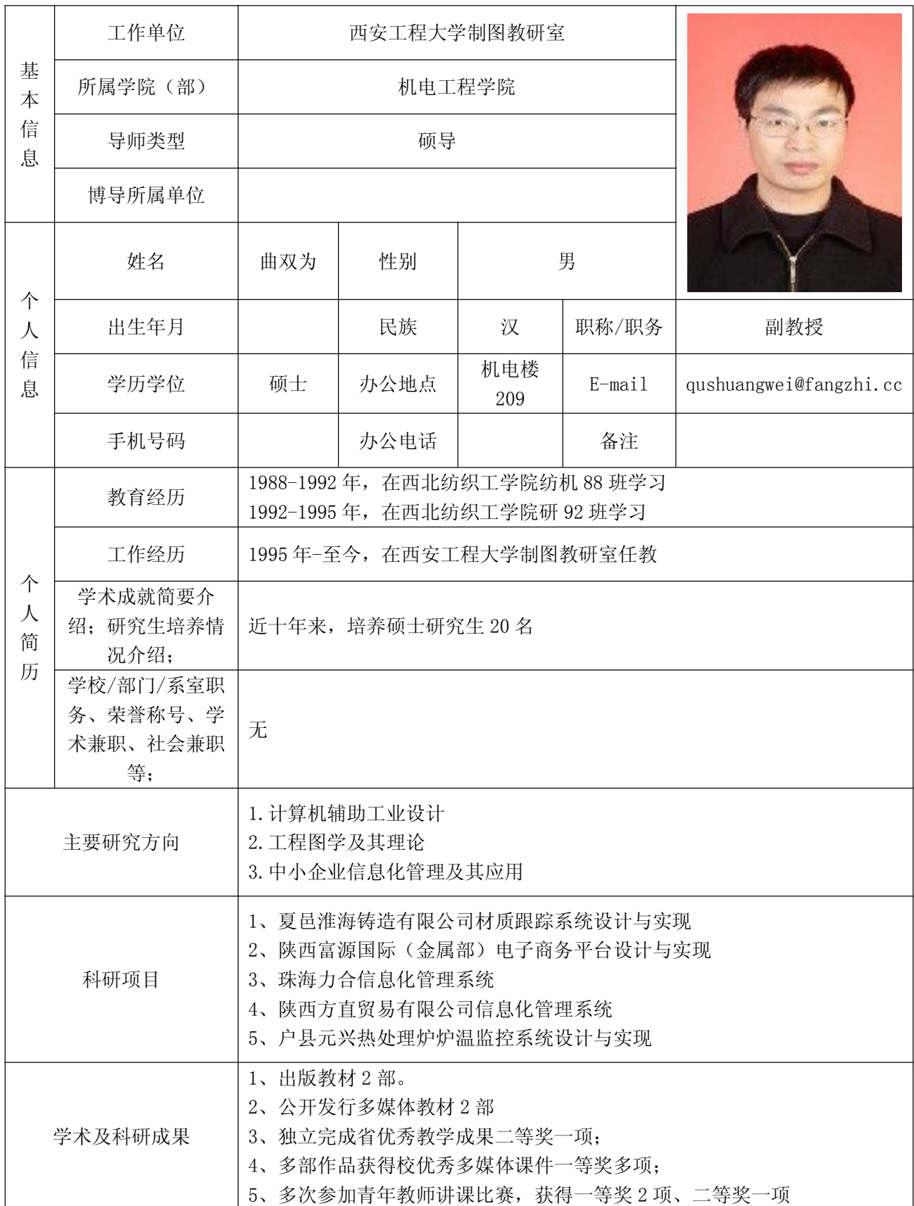
西安工程大学研究生导师信息表